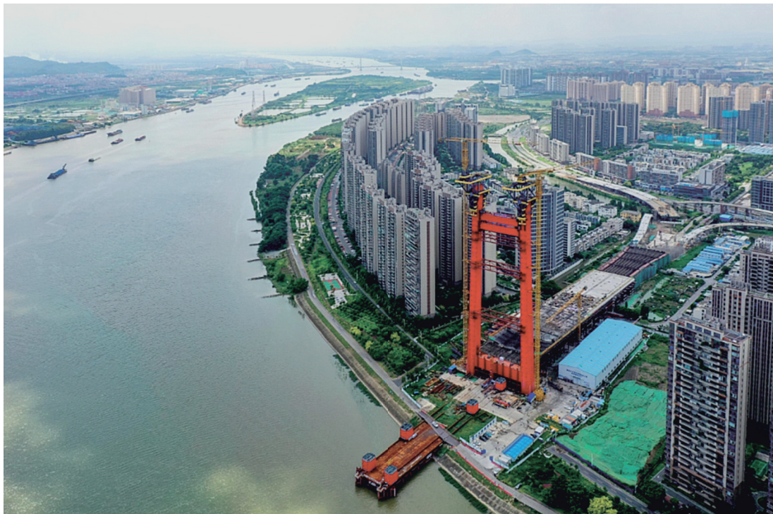
广东佛山市一景。

近日，广东佛山市三水区南山镇发布的《2023年度躺平休闲人员拟定名单公示》引发热议。网传图片显示，该地通过谈话和评议等环节，将8名政府工作人员列入“躺平休闲人员”的拟定名单。据悉，当地政府会给予这些人6个月整改期。如果在整改期间表现良好，这些人就可以从名单中被除名。