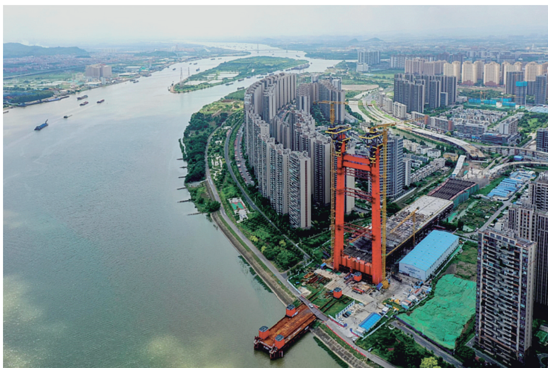
廣東佛山市一景。

近日，廣東佛山市三水區南山鎮發布的《2023年度躺平休閒人員擬定名單公示》引發熱議。網傳圖片顯示，該地通過談話和評議等環節，將8名政府工作人員列入「躺平休閒人員」的擬定名單。據悉，當地政府會給予這些人6個月整改期。如果在整改期間表現良好，這些人就可以從名單中被除名。